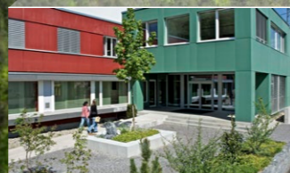
Centro di Protonterapia