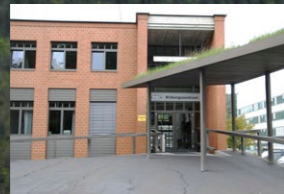
Centro di Formazione del PSI