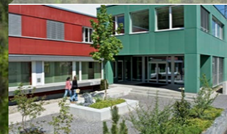
Centre de protonthérapie